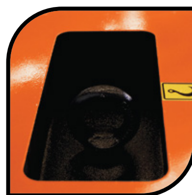
Crochet de levage