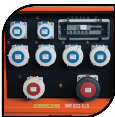
Panneau de prises